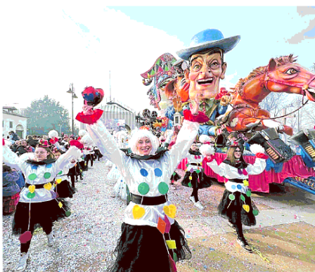
Un mangiafuoco al Carnevale di Chirignago

Il corteo ha raggiunto piazza San Giorgio dove ad attenderli c'era un grande